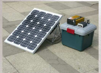
分解移動式太陽光発電装置

視覚障害者用の「SPコード」です。 専用の読み取り機で音声にて読み上げます。 規格上、用紙の端から25mmに配置することと SPコードの周囲4mmは余白とすることが 定められています。